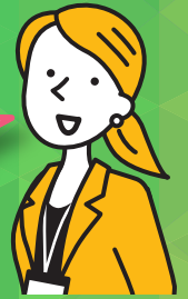
現場リーダー層 受講修了者