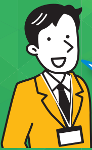
エントリー層 受講修了者